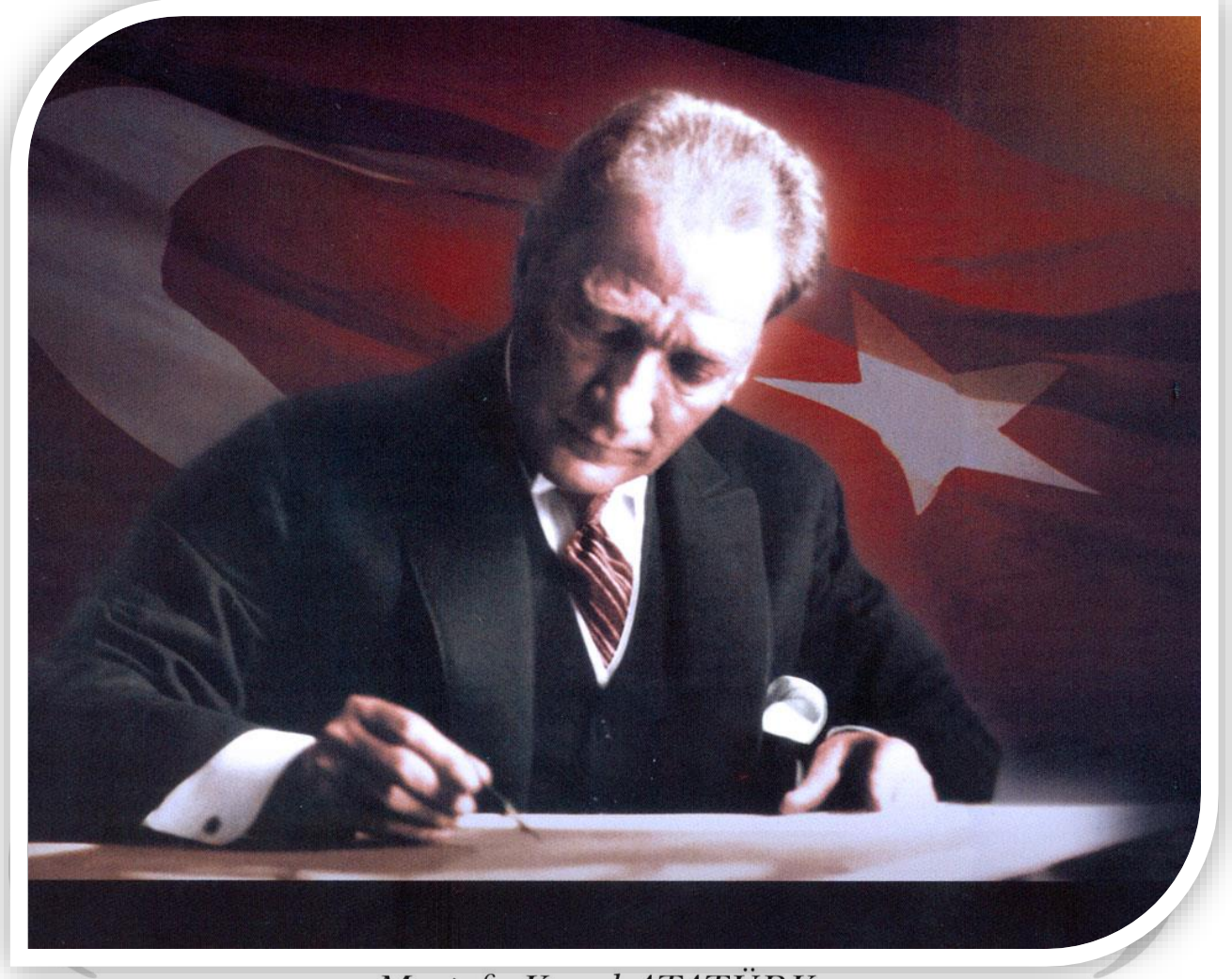
Mustafa Kemal ATATÜRK